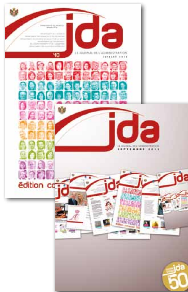
Les Unes des JDA n° 40 (Juillet 2012) et n° 50 (Septembre 2013), deux éditions collectors.

En novembre 2014 paraît le numéro 60, un nouveau format avec une taille réduite (environ 20 cm x 27 cm), une organisation sur 28 pages - ce qui offre alors deux doubles-pages à chaque Département - et une maquette revue : la photo de Une est plus grande grâce au déplacement de l'édito sur les pages de garde, lesquelles accueillent désormais le Carnet de la Fonction Publique, un sommaire, le « Geste éco-responsable », le « Tweet du mois » (issu des publications du compte du Gouvernement) et un « Zoom » (une actualité illustrée). D'autre part, le logo du journal est simplifié. Enfin, une rubrique qui avait déjà fait son apparition dans quelques numéros précédents