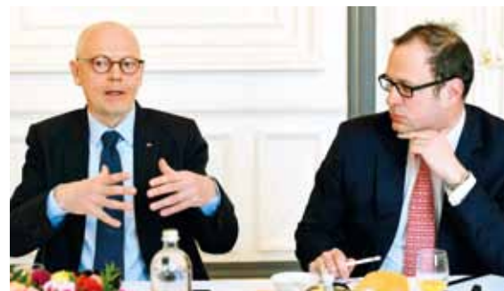
Serge TELLE, Ministre d'État, aux côtés de Frédéric GENTA, Délégué Interministériel chargé de la transition numérique, pour présenter les enjeux de la transition numérique pour Monaco à l'occasion d'un petit-déjeuner avec la presse organisé le 27 mars 2018.

Enfin, compte tenu du caractère transversal de ses missions et pour une collaboration renforcée avec la DITN, l'Agence Monégasque de Sécurité Numérique (AMSN) est rattachée au Ministère d'État.