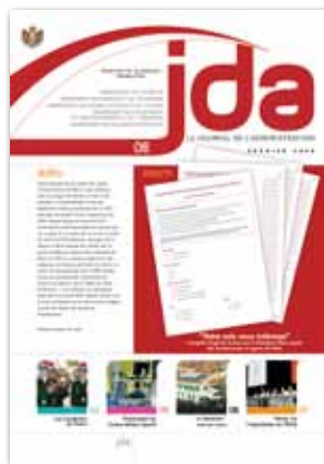
La Une du JDA n° 6 (Février 2009) était consacrée à l'enquête « Votre avis nous intéresse ».