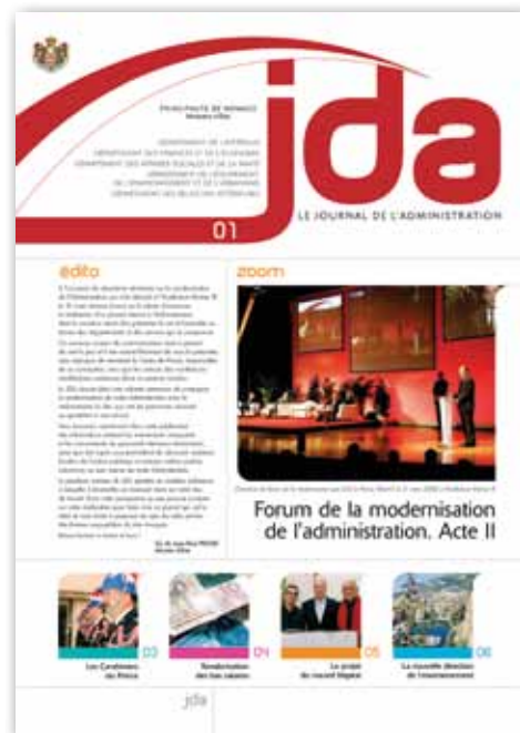
La Une du JDA n° 1 (Juin 2008) évoquait l'ouverture, menée trois mois plus tôt par S.A.S. le Prince Souverain, du deuxième séminaire sur la modernisation de l'Administration, rendez-vous au cours duquel fut annoncé le lancement d'un journal interne correspondant à ce processus initié en 2006.

L'histoire de la création du JDA est racontée dans sa première édition, parue en juin 2008, dans un édito signé par celui qui était alors Ministre d'État, Jean-Paul PROUST : « À l'occasion du deuxième séminaire sur la modernisation de l'Administration (un processus lancé à l'automne 2006, ndr) qui s'est déroulé à l'Auditorium Rainier III le 31 mars 2008, j'avais eu le plaisir d'annoncer la réalisation d'un journal interne à l'Administration, dont la vocation serait d'en présenter la vie et l'actualité à travers les Départements et les Services qui la composent. Ce nouveau moyen de communication vient à présent de voir le jour [...] Le JDA s'inscrit dans une volonté commune de conjuguer la modernisation de notre Administration avec le renforcement du lien qui unit les personnes œuvrant au quotidien à son service ».