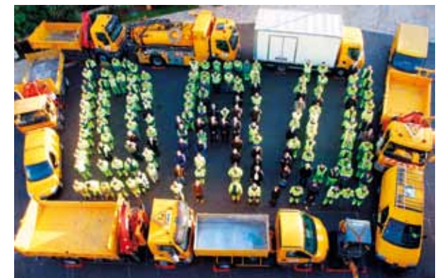
L'Équipe de la Direction de l'Aménagement Urbain disposée de sorte à former l'acronyme « DAU ».

la tutelle administrative des sociétés concessionnaires SMEaux, SMEG et SMA.