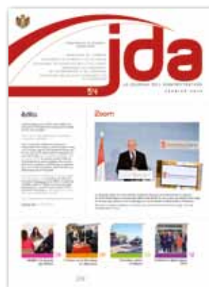
La Une du JDA n° 54 (février 2014) était dédiée à la conférence de presse du Gouvernement au cours de laquelle fut dévoilé le nouveau logo.