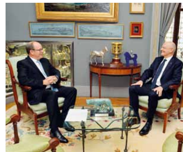
S.A.S. le Prince Souverain en entretien avec Serge TELLE le 1 er février 2016, juste après la prestation de serment de ce dernier.