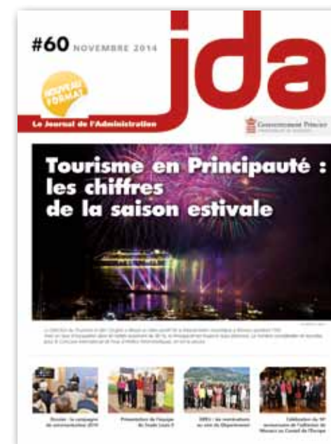
La Une du JDA n° 60 (novembre 2014), lequel marque le début d'une nouvelle formule.

La Direction de la Communication, chargée de la conception, de la rédaction et de l'illustration du JDA, tient à remercier l'ensemble des personnes qui ont contribué à faire vivre cette « version papier » durant toutes ces années : les différents référents des Départements et du Secrétariat Général du Gouvernement qui nous ont notamment appuyés dans l'élaboration des sommaires, les fonctionnaires et agents de l'État interviewés ou qui nous ont fourni les informations nécessaires à la réalisation des articles, les élèves fonctionnaires stagiaires de la Formation Supérieure d'Administrateurs (FSA) qui nous ont aidés à la rédaction, ou encore les Photographes du Palais Princier. Et merci, bien entendu, à tous nos lecteurs pour leur soutien !